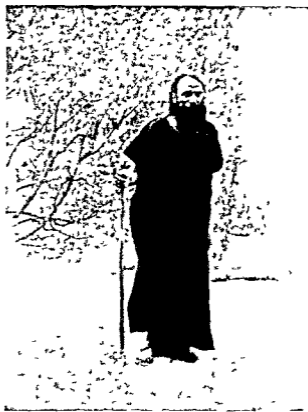
दाता अलपी में